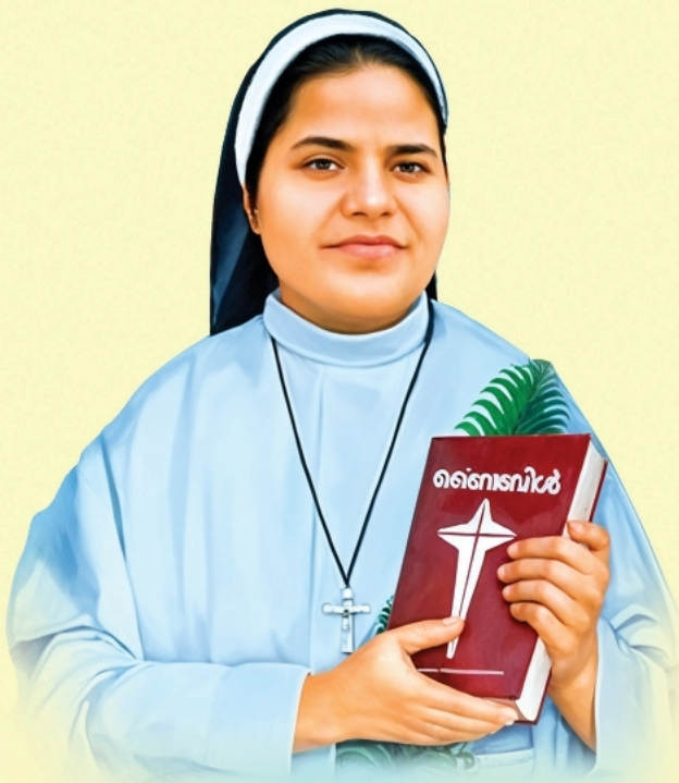
BLESSED RANI MARIA