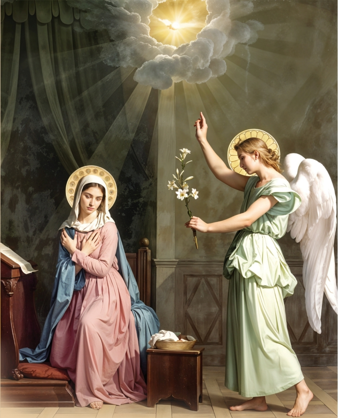
Feast of the Annunciation, March 25